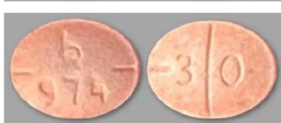
Izquierda: tabletas de oxidona M30 auténticas (arriba) (también conocidas como Percocet) frente a tabletas de oxidona M30 falsificadas que contienen fentanilo (abajo). Centro: tabletas de Adderall auténticas (arriba) frente a tabletas de Adderall falsificadas que contienen metanfetamina (abajo). Derecha: tabletas Xanax auténticas (blancas) frente a tabletas Xanax falsificadas que contienen fentanilo (amarillo).